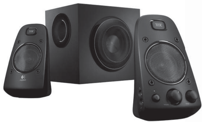
Model: S-00105 (110V~) S-00104 (220-240V~)